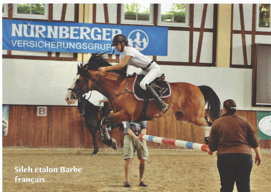
Sileh étalon Barbe français

Dans la classe des mâles Barbes de cinq à huit ans, douze étalons étaient présentés au jury dans le manège couvert du Haras Tannenhof. Avec un ensemble parfait, dans une ambiance toute féérique, chaque candidat a été présenté par son propriétaire aux trois allures et à la pose.