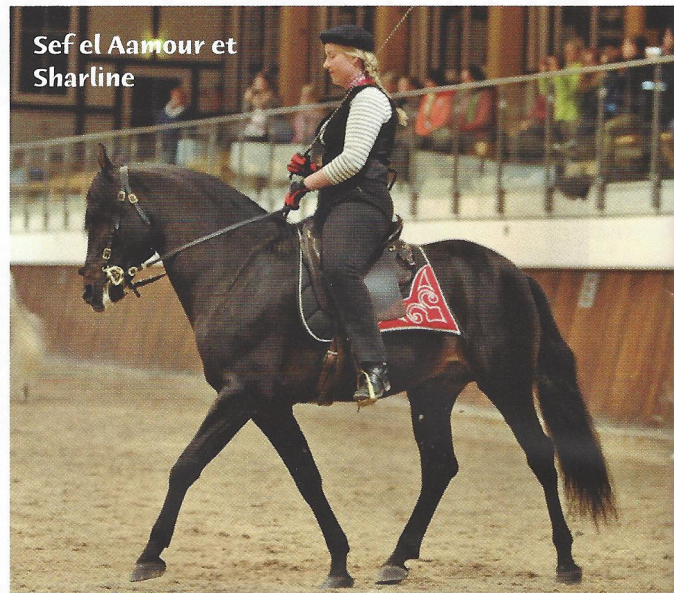
Sef el Aamour et Sharline