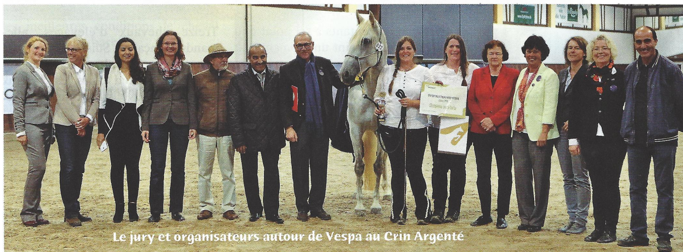
Le jury et organisateurs autour de Vespa au Crin Argenté

La meilleure jument Barbe du Championnat est pour cette année la